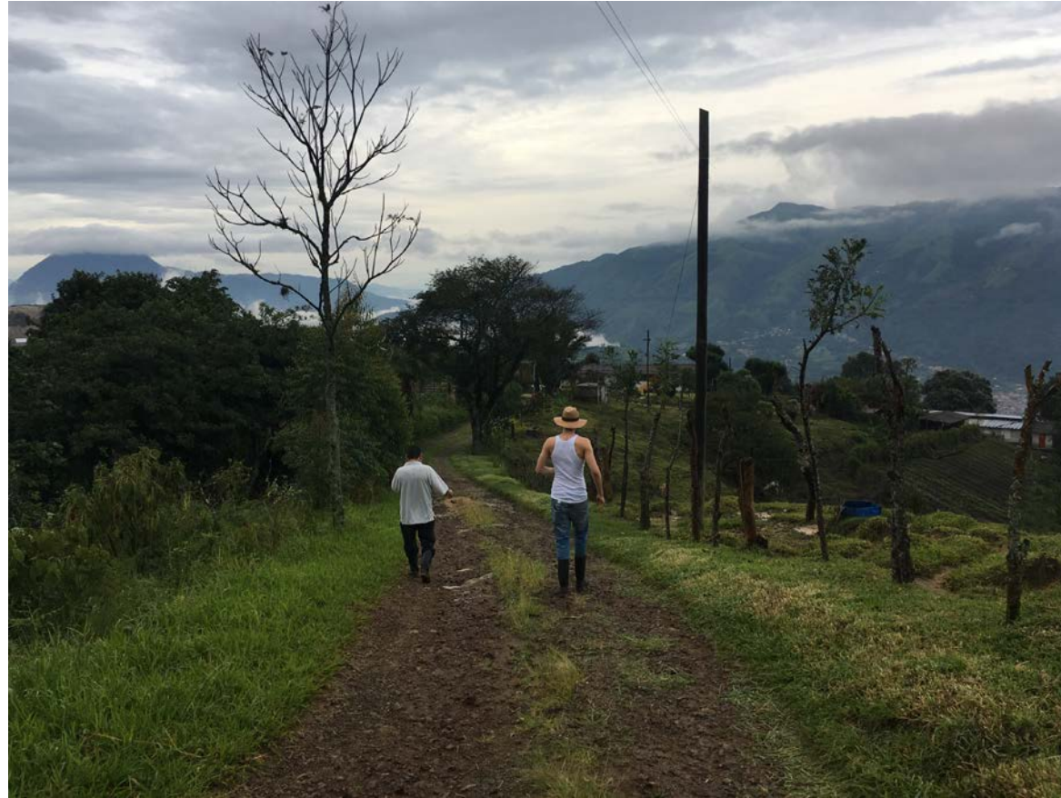
Auf der Farm Guayacanes