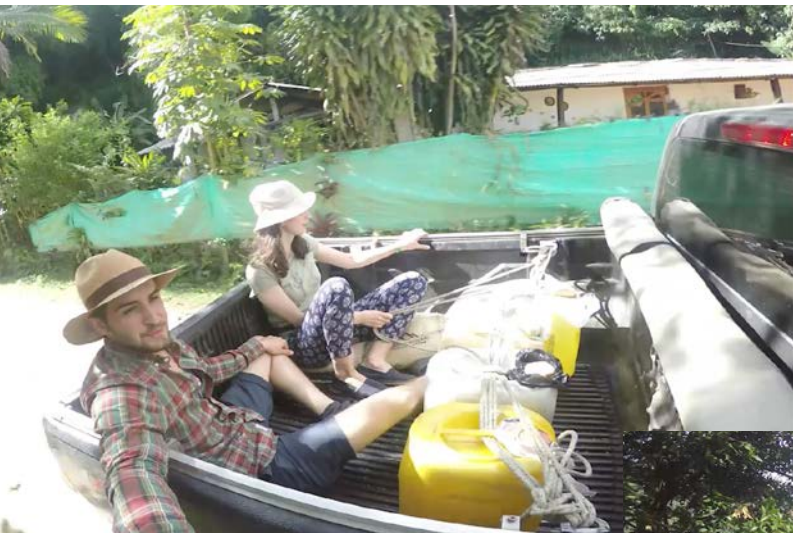
Auf der Fahrt zur ersten Plantage

Auf unserer Reise haben wir fünf Plantagen besuchen können, welche alle im Departamento Antioquia liegen. Zwei der Plantagen lagen in unmittelbarer Nähe zur berühmten Metropole Medellín. Die anderen drei in der Gegend um Bolívar.