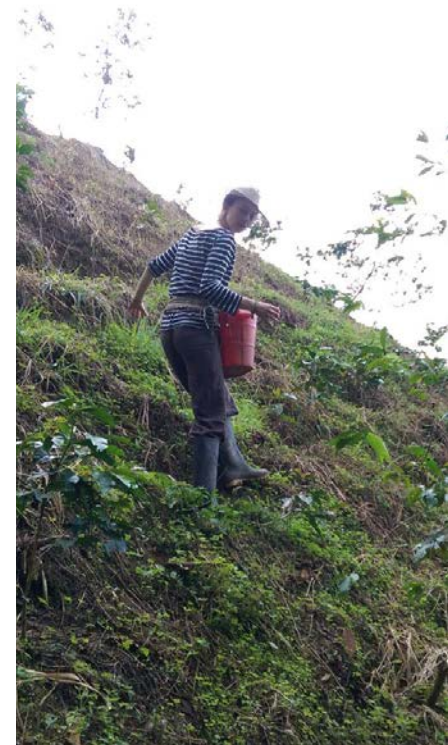
Hanna beim Düngen