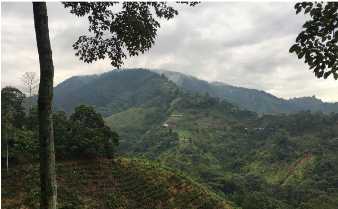
Farmarbeit in der Nähe von Medellín

Außerdem verbrachten wir ein paar Tage mit einem Spezialitätenkaffee-Exporteur. Bei ihm konnten wir alle kaufmännischen Fragen loswerden und sehr viel über Kaffeeanbau, Aufbereitung und die Exportvorbereitung lernen.